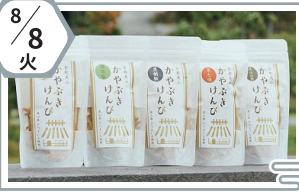
里のごほうび みやま堂