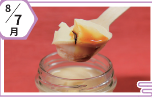
料理工房 ホワイトファミリー