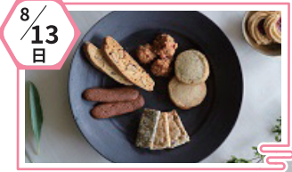
biosweets capocapo 菓歩菓歩