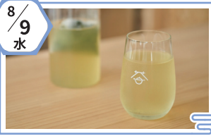
有限会社 山城屋茶舗