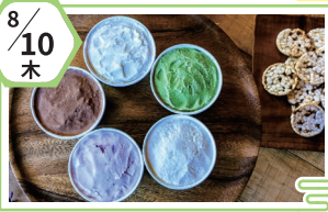
株式会社ライズウィン MINORI工房