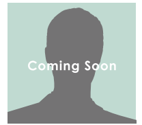
著名なアツギ経営者 一近日登壇決定ー