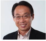
岡田 武史氏 FC今治高校学園長 元サッカー日本代表監督

地域経済における既存事業の可能性や新たな挑戦に対する心構え、組織経営のマネジメントについて語る。