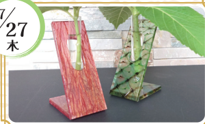
京都樹脂株式会社