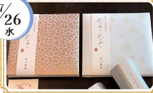
Kamikami~紙加美 by 西川紙業