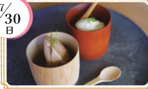
高野竹工株式会社

地域企業の魅力をお届けします。 京都信用保証協会が金融と経営をサポートする、京都の企業の魅力ある隠れた逸品をご紹介します。四条烏丸大垣書店内イベントスペースに日替わりでラインナップされます。皆様のご来場をお待ちしております。