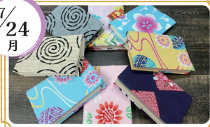
株式会社 斉藤商店